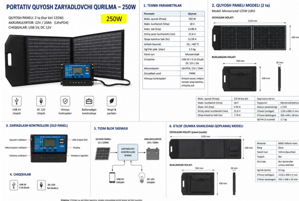
1-rasm. Mobil quyosh energetik tizimining umumiy ko'rinishi.

O'lchov: voltmetr, ampermetr, pyranometr, termometr